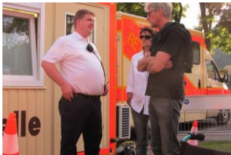
Der Vorsitzende informiert sich vor Ort