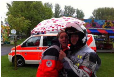
Viele Helfer sind auch privat eng befreundet