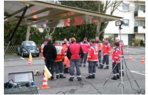
Lehrgang „Strom im Einsatz“