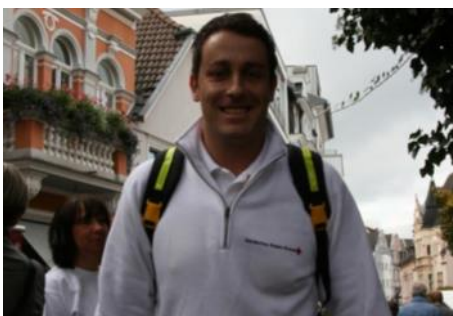
Der freundliche Helfer auf den Stadtfesten