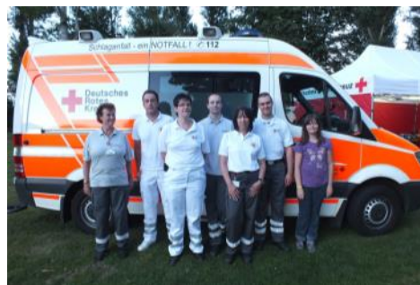
Gruppenbild „Sommerkino“ Insel Grafenwerth