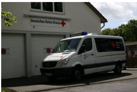
Neues „Arbeitspferd“ für den Ortsverein