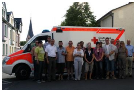
Teilnehmer des Digitalfunklehrgangs