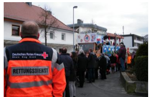
Einsatzkräfte im Karnevalszug