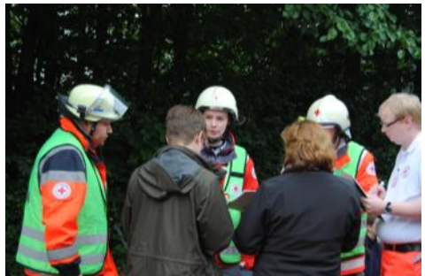
Workshop / Praxistraining der Pressesprecher