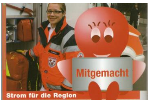
Beitrag für die BHAG Broschüre