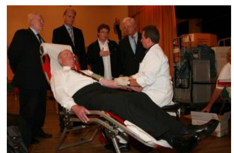
Mitglieder des Aalkönigkomitees spenden Blut