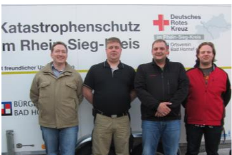
Bereitschaftsleitung & Krisenmanager (Intern)