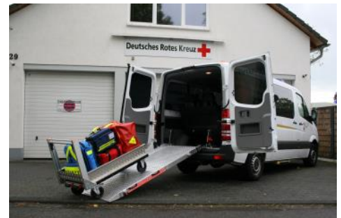
Mannschaftswagen mit Ausstattung „SEG Ärzte“