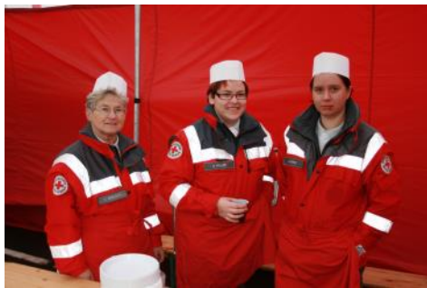
Helfer des Verpflegungsdienstes