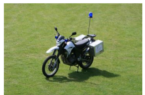
Neues Motorrad für den Katastrophenschutz