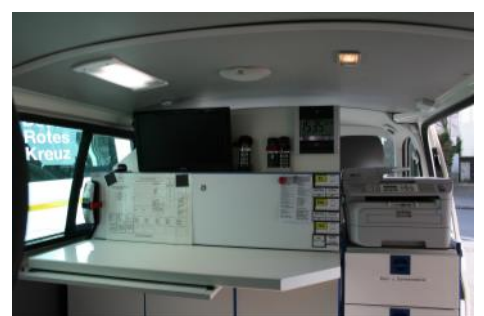
In Eigenleistung wurde der ELW erweitert