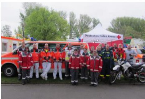
Einsatzkräfte bei „Rhein in Flammen“