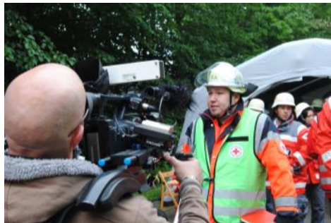
Interview mit dem Pressesprecher des OV