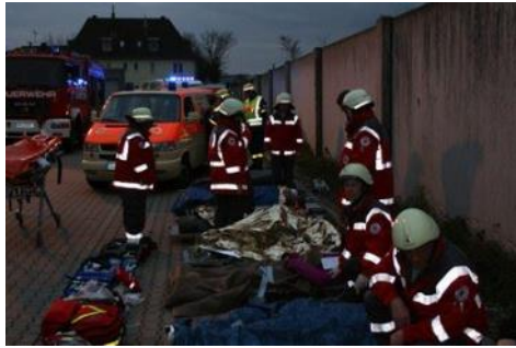
Patientenablage bei einer Übung