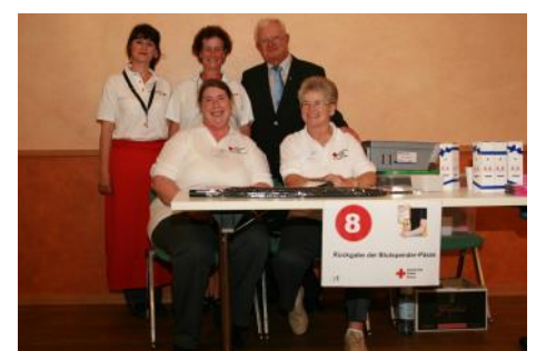
Der DRK Präsident mit einem Teil des Teams