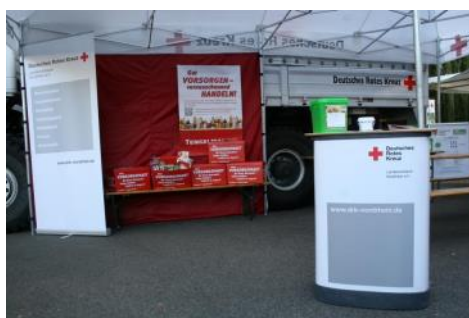
Präsentationsstand / Unterstützung Landesverband