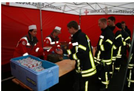
Verpflegung von Einsatzkräften der Feuerwehr