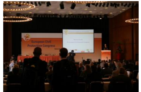
8. Europäischer Bevölkerungsschutzkongress