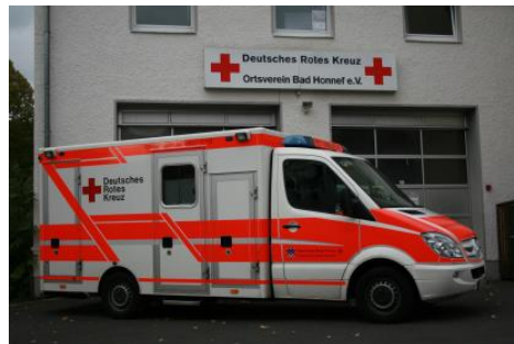
Rettungswagen 1 vor der Rettungswache