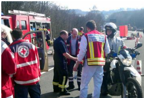
Motorradstaffel des Ortsvereins im Einsatz