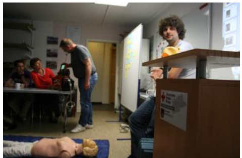
Erste Hilfe Workshop