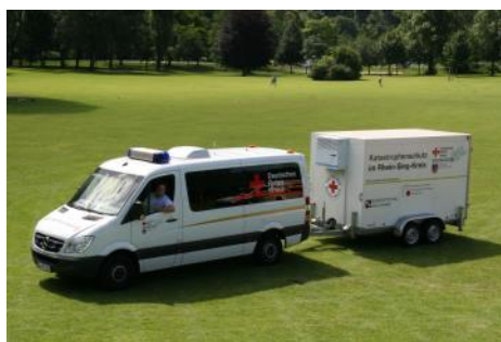
Neuer Mannschaftswagen mit dem Kühlanhänger