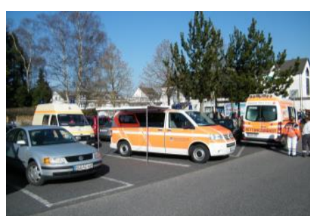
Bereitstellungsraum Karneval (Aegidenberg)