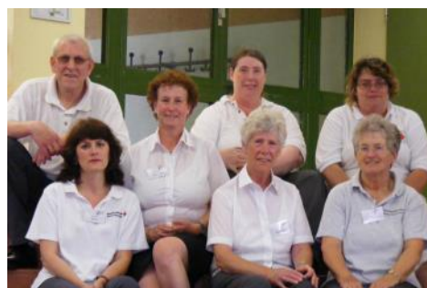
Gruppenfoto des Blutspendeteam