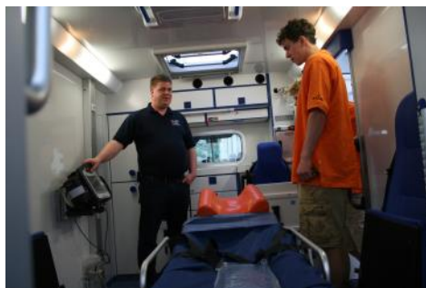
Die Dragons Rhöndorf zu besuch beim DRK