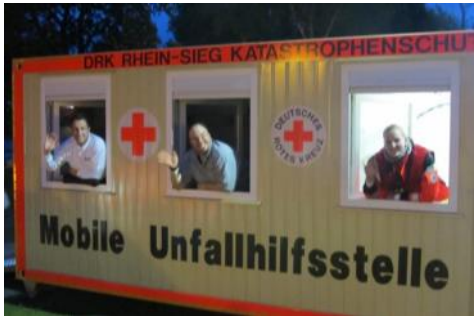
Spaß bei der Arbeit—die Ruhe vor dem Sturm