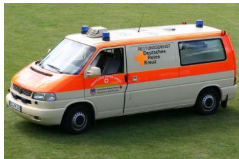
Krankentransportwagen des Ortsvereins