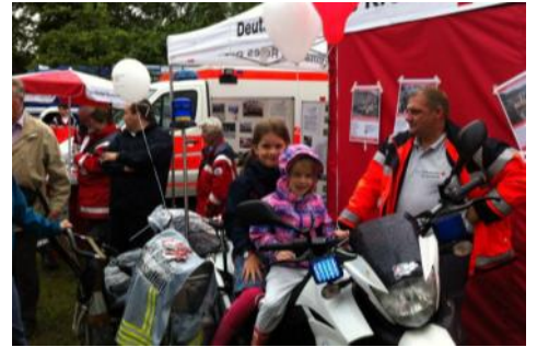
Präsentation auf im Reitersdorfer Park