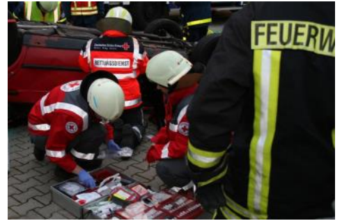
Rettungsdienst und OV arbeiten gemeinsam