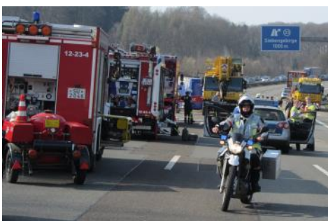
Krad im Einsatz—Gefahrgutunfall auf der BAB 3