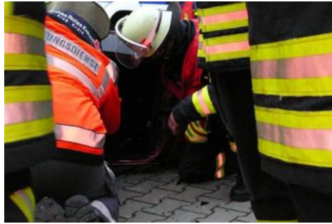
Zusammenarbeit mit der Feuerwehr