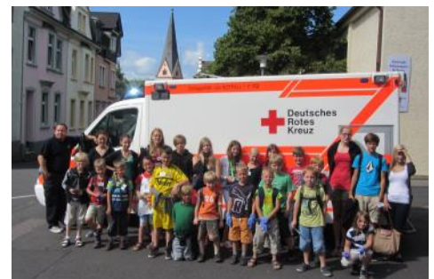
Kinder der Ferienherholung zu Gast beim DRK