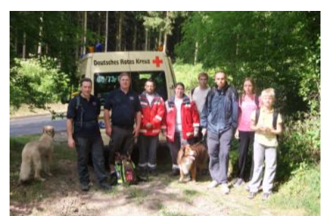
Alle Jahre wieder: Volkswandern im Siebengebirge