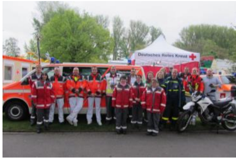
Rettungs- und Sanitätsdienst bei Rhein in Flammen