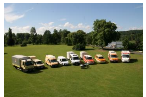
Fuhrpark des Ortsvereines