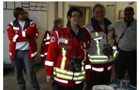
Frauen als Chef? Na klar!