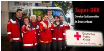
Schlagzeile bei honnefshopping.de

Das Rote Kreuz ist einer der sechs Spitzenverbände der Wohlfahrtspflege in Deutschland. Hilfe zur Selbsthilfe, Unterstützung und einfach auch das „Für jemanden da sein“. Viele verschiedene Punkte der Wohlfahrtspflege bedeuten Dienstleister zu sein. Eine moderne, aber leider noch nicht selbstverständliche Ansicht. Wir vom Roten Kreuz haben es verstanden. Dieses wurde dem Roten Kreuz in diesem Jahr einmal mehr bescheinigt. Kundenumfragen eines unabhängigen Institutes ergaben, dass das Rote Kreuz Spitzenreiter in der Servicezufriedenheit unter den Wohlfahrtsverbänden ist. Dieses spiegelt auch die Zufriedenheit der Honnefer mit Ihrem Roten Kreuz wieder.