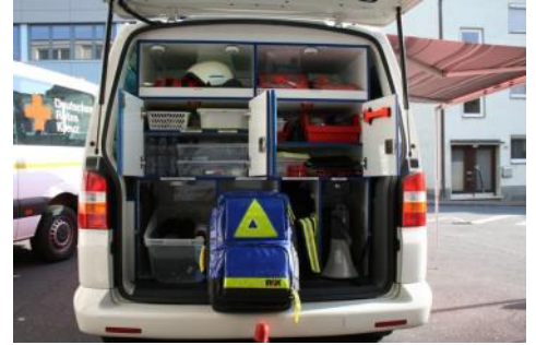
Neue Ausstattung des Einsatzleitwagens