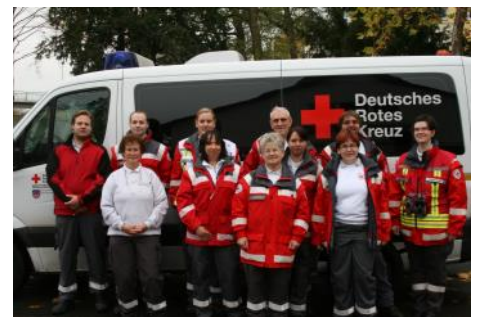
Gruppenbild bei einer Übung