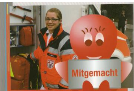
Rettungsdienst in der Presse