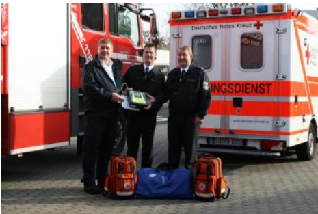
Übergabe von Rettungsmaterial an die Feuerwehr