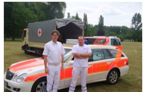
Notarztfahrzeug am Rande einer Großveranstaltung